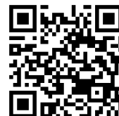
講座WebページQRコード

https://www.dei.or.jp/school/kouza_idkiso