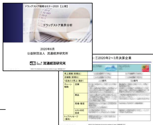
(セミナー報告資料のイメージ)