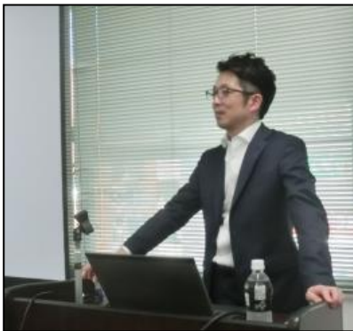
(株)ワーク・ライフバランスによる講演 「経営戦略としての働き方改革」 (金沢会場 8月21日)